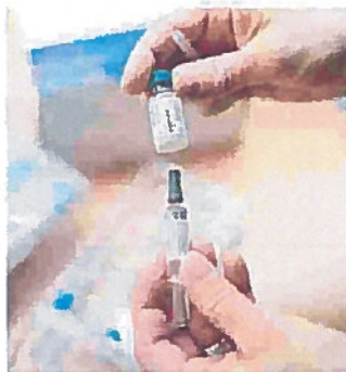
Vaccini al centro del dibattito